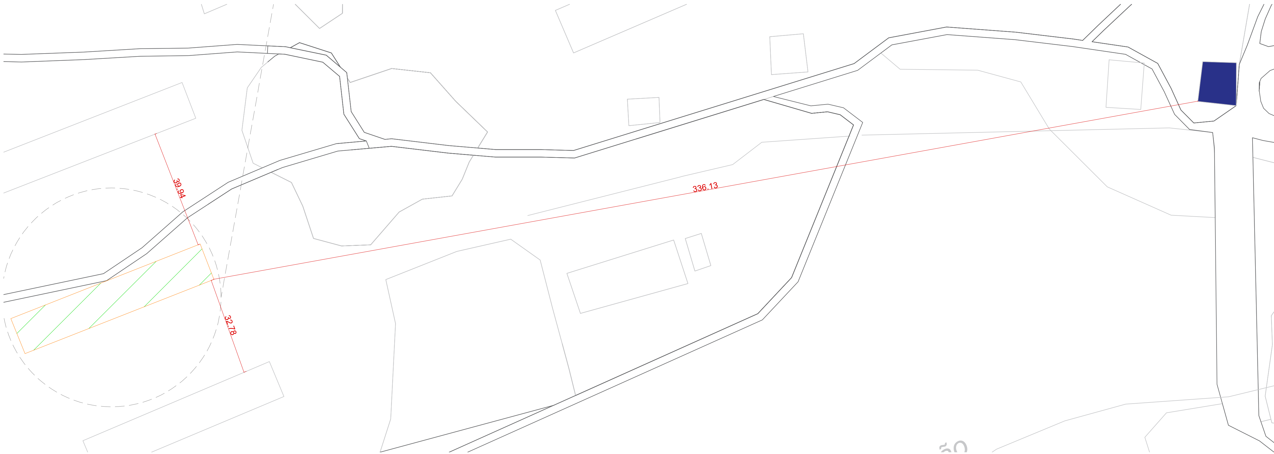
PLANTA DE LOCALIZAÇÃO ESCALA.: 1/500