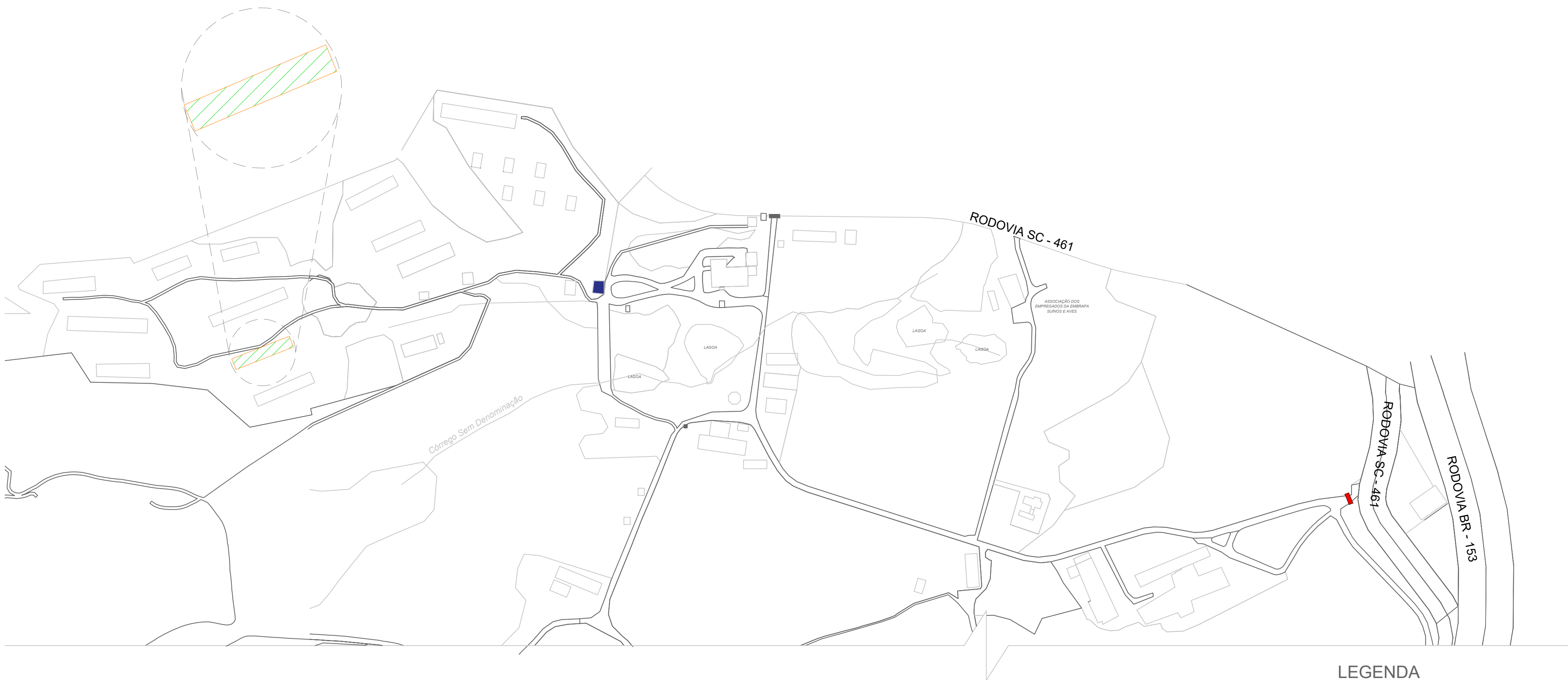
PLANTA DE SITUAÇÃO ESCALA.: 1/2.250